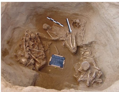
Εικ. 4. Καλύβια Ήλιδας. Θαλαμωτός τάφος με πολλαπλές ταφές της πρώιμης εποχής του Χαλκού.

γείται στην υστεροελλαδική III A2-Γ περίοδο (14ος-12ος αι. π.Χ.). Το πλέον ενδιαφέρον εύρημα προέρχεται από λάκκο που περιείχε γυναικεία ταφή. Το κρανίο της νεκρής διατηρούσε διάδημα με τρεις σειρές ανάγλυφων χανδρών-πλακιδίων από κυανή υαλόμαζα (εικ. 5).