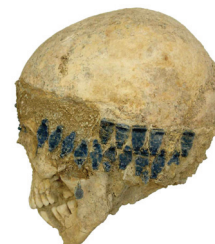
Εικ. 5. Καυκανιά, θέση «Καραβάς». Γυναικείο κρανίο με διάδημα από πλακίδια υαλόμαζας.

Από τον Αύγουστο έως το Νοέμβριο του 2006, στο πλαίσιο συστηματικής ανασκαφής, βάσει αποφάσεως του ΥΠΠΟΤ, απομακρύνθηκε η ογκώδης κατάκωση από ασφαλτικό υλικό, αποκαλύφθηκε το ναϊκό οικοδόμημα εντός και εκτός της τοιχοποιίας, έγιναν δοκιμαστικές τομές στον περιβάλλοντα χώρο και διαπι-