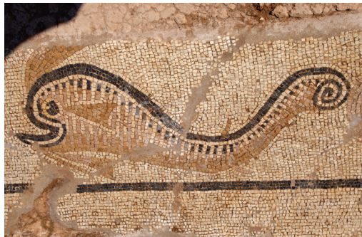
Εικ. 11. Σκαφιδιά, θέση «Λουτρό». Λεπτομέρεια ψηφιδωτού δαπέδου με δελφίни.

Στον Κλαδέο Ολυμπίας (θέση «Τρύπες») συστάδα 17 θαλαμωτών τάφων απέδωσε άφθονα και ποικίλα ευρήματα κατά τα έτη 2006-2007. Μερικά από αυτά σπανίζουν στη μυ-