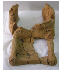
Εικ. 9. Ολυμπία (ΔΟΑ). Πήλινος ενεπίγραφος Κέρβερος.