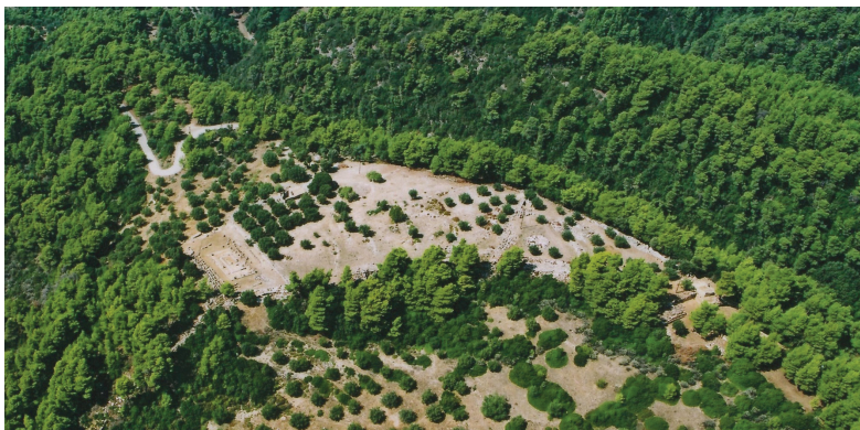
Εικ. 3. Λέπρεο. Αεροφωτογραφία ακρόπολης.