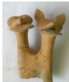
Εικ. 8. Ολυμπία (ΔΟΑ). Πήλινος Κέρβερος με πόπανα.