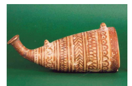
Εικ. 12. Κλαδέος (Τρύπες). Κερασοειδές αγγείο κατ' απομίμηση κυπριακού.

Στον Μάγειρα Ολυμπίας αποκαλύφθηκαν μετά τις καταστροφικές πυρκαγιές (2007-2008) τέσσερις μυκνναϊκοί θαλαμωτοί τάφοι με πλούσια κτερίσματα, μεταξύ των οποίων μεγάλοι δίσκοι και τετράωτοι αμφορείς, αρκετές χάνδρες κοσμημάτων υαλόμαζας, χρυσού και φαγεντιανής, σφονδύλια, και δύο