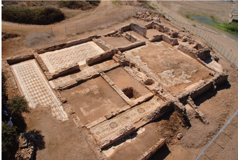
Εικ. 10. Σκαφιδιά, θέση «Λουτρό». Γενική άποψη της ρωμαϊκής λουτρικής εγκατάστασης.

βέβαιο ότι ανήκει στον περιβάλλοντα χώρο του ιερού της θεάς. Είναι αξιοσημείωτο ότι για πρώτη φορά έρχονται στο φως αρχαιολογικά ευρήματα που φωτίζουν αυτή την ιδιόμορφη χθόνια υπόσταση της Δήμητρας στην Ολυμπία, καθώς μέχρι πρότινος ήταν γνωστός μόνον ο λίθινος βωμός της ιέρειας της θεάς στο βόρειο πρηνές του σταδίου, από όπου παρακολουθούσε τη διεξαγωγή των Ολυμπιακών Αγώνων (εικ. 7-9).