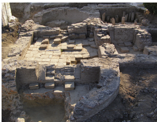
Εικ. 19. Πλατιάνα. «Η κυρία της Πλατιάνας». Επιτύμβια γυναικεία προτομή.

Στην Κουρούτα Αμαλιάδας , παραλιακή περιοχή κοντά στην πόλη της Αμαλιάδας, κατά τις εργασίες κατασκευής νέων κελιών βόρεια της Ι.Μ. Αγίου Αθανασίου, ήλθε στο φως το 2009 λουτρικό συγκρότημα ρωμαϊκών χρό-