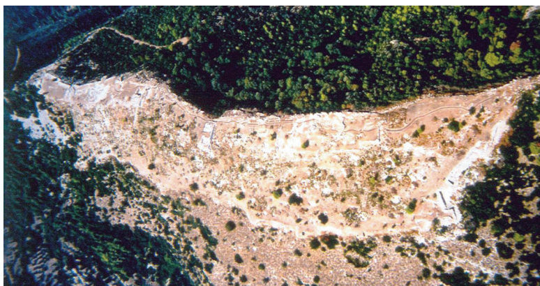
Εικ. 18. Πλατιάνα. Γενική άποψη της ακρόπολης. Αεροφωτογραφία.