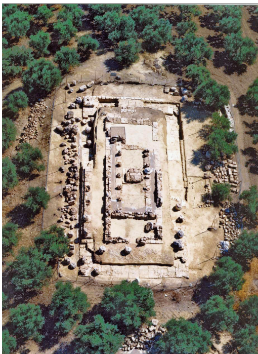
Εικ. 1. Πρασιδάκι. Ο δωρικός ναός της Αθηνάς. Αεροφωτογραφία.

Στο σημερινό χωριό Πρασιδάκι (θέση «Ελληνικό» ή «Λενικό») ερευνήθηκε κατά τα έτη 1999-2000 δωρικός ναός αφιερωμένος στη θεά Αθηνά, πρώιμων κλασικών χρόνων. Το 2002 κατά τη διάρκεια εργασιών συντήρησης αποκαλύφθηκε τμήμα του αρχαϊκού ναού. Ο δωρικός ναός, χτισμένος από μαλακό πωρόλιθο, είναι περίτερος (6x13 κίονες) εν παραστάσι. Διαθέτει πρόναο, σπκό και οπισθόδομο και εδράζεται σε τρίβαθμη κρηπίδα, η οποία πατά σε ισχυρή ευθυντηρία.