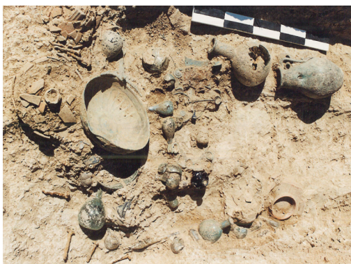
Εικ. 2. Μιράκα, θέση «Βελμαχαίκα». Το περιεχόμενο του ρωμαϊκού λακκοειδούς τάφου.

Στην Καυκανιά Ολυμπίας (θέση «Καραβάς»), εντοπίστηκε το 2006 και ερευνήθηκε μεγάλος μυκηναικός τραπεζιόσχημος θαλαμωτός τάφος (διάστ. 3,50 x 4,13 μ.) με επάλληλα ταφικά στρώματα πλούσια σε κτερίσματα (αμφορείς, αλάβαστρα, άωτα σφαιρικά πιθάρια, πιθαμοφόρισκοι, κύπελλο, κυάθια, προχοϊσκη από τεφρό πηλό, δύο χάλκινοι ξυροί, τριχολαβίδα, χάλκινη περόνη και 16 σφονδύλια), σύμφωνα με τα οποία το μνημείο χρονολο-