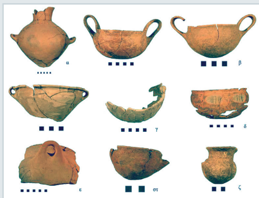
Εικ. 8. Χαρακτηριστική κεραμική: α) αμφορέας, β) κánθαρoι, γ) μινυακά αγγεία, δ) φιάλη, ε) χυτροειδές αγγείο, στ) μικρή φιάλη, ζ) κύπελλο με καλαθόσχημη λαβή και δύο μαστοιδείς αποφύσεις.