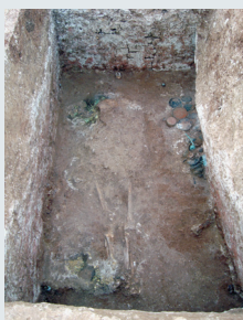
Εικ. 16. Τάφος 5 (λεπτομέρεια).