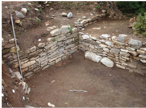
Εικ. 11. Λειβηθρα. Άποψη των κτισμάτων στο ανατολικό τμήμα της ακρόπολης.

Το Κομπολόι είναι μία από τις ανασκαφές που προκάλεσαν τα μεγάλα Τεχνικά Έργα στην είσοδο της Μακεδονίας από τα Τέμπε, στην πεδινή περιοχή των Λειβήθρων, όπου ανασκάφηκαν κατά τη διάρκεια εργασιών για την κατασκευή της νέας σιδηροδρομικής γραμμής τρία ανασκαφικά μέτωπα. Από Ν. προς Β. ονομάστηκαν Κομπολόι, Ντουβάρι Ι και Ντουβάρι ΙΙ. Καλύτερα σωζόμενο και σημαντικότερο είναι το Κομπολόι, που βρίσκεται στη χ.θ. 7000+400-7000+455. Η εθνική οδός Ε-75 διέρχεται 500 μ. Δ. και η ακτογραμμή της Σκοτίνας απέχει 700 μ. προς Α. Ο ανεσκαμμένος χώρος στο Κομπολόι είχε έκταση 3.560 τ.μ. Οι ανασκαφικές εργασίες ξεκίνησαν στα τέλη Μαΐου του 1997 και ολοκληρώθηκαν τον Οκτώβριο του 2000