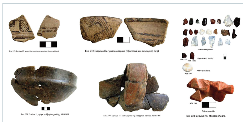
Εικ. 14. Πηγή Αθηνάς. Ευρήματα Νεολιθικής εποχής.

Σε αμέσως χαμηλότερο επίπεδο η ανασκαφή αποκάλυψε ένα νεκροταφείο τύμβων σε ευθεία γραμμή πάνω και κάτω από την εθνική οδό. Οι τύμβοι της Πηγής Αθηνάς ήταν κατασκευασμένοι από τρόχαλα των παρακείμενων ρεμάτων και περιβάλλονταν από έναν ή δύο δακτυλίους. Στον τύμβο υπήρχε πάντα ένας κεντρικός τάφος, που κάποτε ήταν ο μοναδικός. Ήταν κατά κανόνα ο μνημειοκότερος, πιθανόν ο τάφος ενός κεντρικού νεκρού της οικογένειας. Οι ταφές ήταν όλες ατομικές, συνήθως με ένα αγγείο ως κέρισμα.