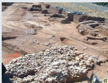
Εικ. 6. α) Γενική άποψη της ανασκαφής. Διακρίνονται οι Περιβόλοι 2 και 3, η «Κατασκευή Π», ο Μεγάλος Τύμβος (Τύμβος 1) και το Κτίριο Β.