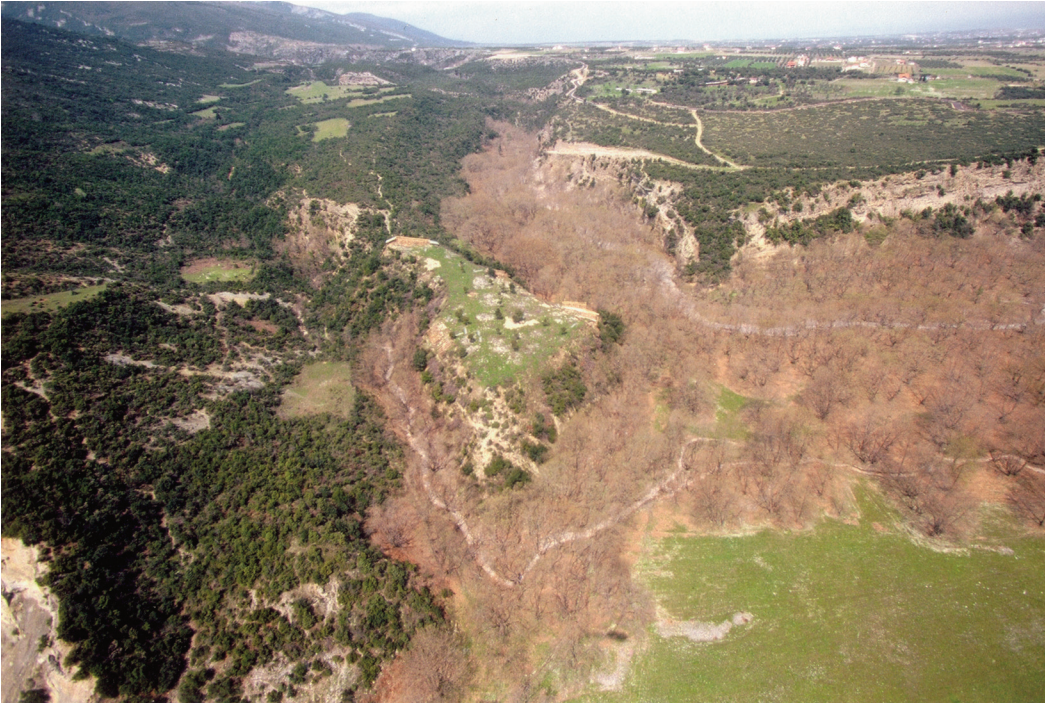
Εικ. 10. Λειβηθρα. Αεροφωτογραφία.

θετείται στην αρχή του 1ου αι. π.Χ., οπότε ο χώρος εγκαταλείφθηκε για πάντα. Η τελική φάση της ακρόπολης αν και αποσπασματική, είναι πληρέστερα ανεσκαμμένη. Τα κτήρια, συνήθως ακανόνιστης κάτοψης, οργανώνονται με ελεύθερο πολεοδομικό σύστημα, με στενωπούς δρόμους ανάμεσά τους. Άγνωστη παραμένει προς το παρόν η έκταση και η μορφή της πόλης. Επιφανειακά οικοδομικά κατάλοιπα και κινητά ευρήματα μάλλον την τοποθετούν βόρεια και δυτικά της ακρόπολης, στην πλευρά με την πιθανή διαμόρφωση της πύλης στο τείχος.