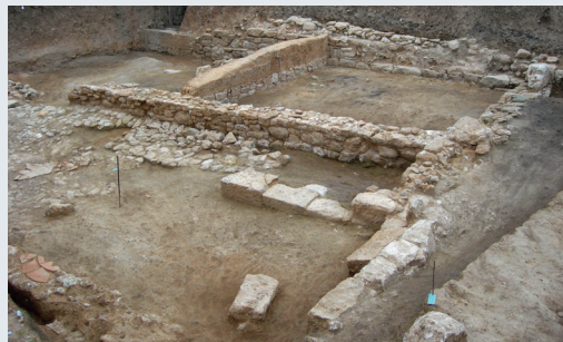
Εικ. 4. Αγροτεμάχιο 274, Κτήριο Β.