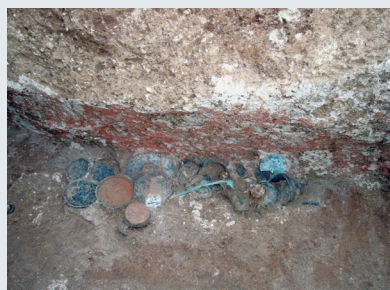
Εικ. 17. Τάφος 15 (λεπτομέρεια).