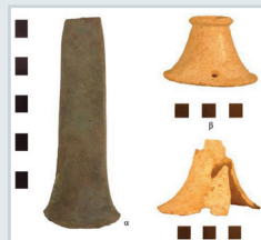
Εικ. 9. Χάλκινος πέλεκυς και λίθινα κωδωνόσχημα αντικείμενα (κτερίσματα ταφών).

όπως μαρτυρείται από την παρουσία πέντε λακκοειδών ταφών, από τις οποίες οι δύο ανήκουν σε παιδιά και η μία είναι πλούσια κτερισμένη με κοσμήματα και αγγεία. Η ποσότητα της κεραμικής και των μικροαντικειμένων από τη θέση είναι μεγάλη, με το κύριο μέρος της να αντιπροσωπεύεται από την φάση 3.