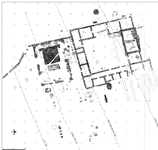
Εικ. 12. Κομπολόι. Γενική κάτοψη του συγκροτήματος.

με μεγάλα διαστήματα διακοπών. Αποκαλύφθηκαν μια αγροικία και οινοπαραγωγική βιοτεχνία (οινηρός πιθεώνας), του τέλους του 4ου και των αρχών του 3ου αι. π.Χ. σε