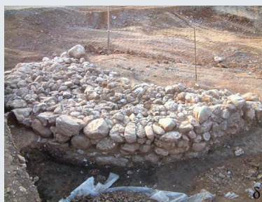
Εικ. 7. Μεγάλος Τύμβος (Τύμβος 1).