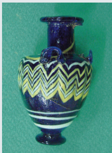
Εικ. 19. Αγγεία τάφου 5.