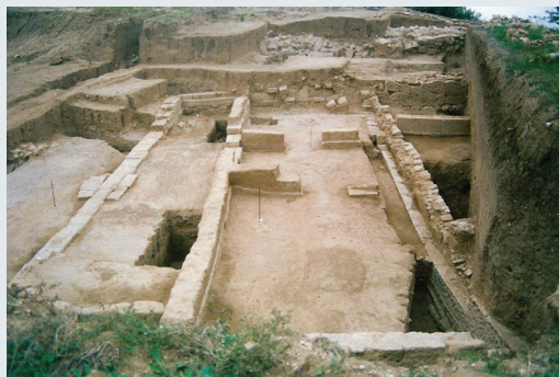
Εικ. 3. Αγροτεμάχιο 274, Κτήριο Α.