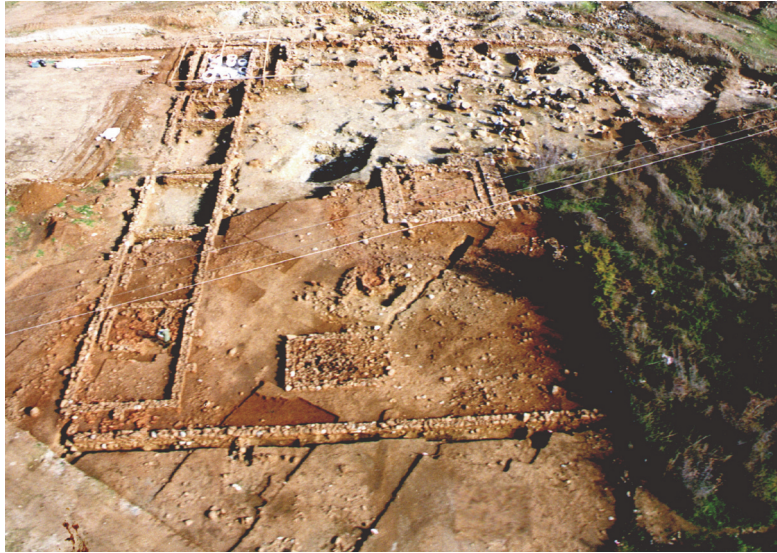
Εικ. 13. Τρία Πλατάνια. Κάτοψη αγροικίας.

καταστροφή, όπως μαρτυρούν τα νομίσματα του Αντίγονου Γονατά και τα δύο θεσσαλικά των Γυρτωνίων (300-196 π.Χ.). Πιθανολογείται η εγκατάλειψή του μετά την επιδρομή των Αιτωλών του Σκόπα, πριν από την τελική καταστροφή του από τους Ρωμαίους, η οποία πιστοποιείται με ασφάλεια από τα νομίσματα του Φιλίππου Ε΄ στις αρχές του 2ου αι. π.Χ.