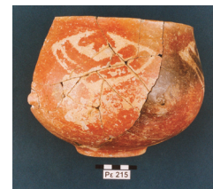
Εικ. 5. Ρεβένια. Γραπτό αγγείο.

Ο Βάλτος 2 (1670-1505 π.Χ.) τοποθετείται χρονικά μετά την καταστροφή της προγενέστερης φάσης από φωτιά και από καταστροφικούς χειμάρρους. Πρόκειται για οργανωμένη εγκατάσταση με πλούσια αρχιτεκτονικά κατάλοιπα. Στον οικισμό κτίστηκαν αυτή την περίοδο τρεις μνημειακοί περίβολοι με ακανόνιστη πορεία που ακολουθούν το φυσικό ανάγλυφο. Κατά την ίδια χρονική περίοδο, ο χώρος χρησιμοποιήθηκε και ως νεκροταφείο, όπως αποδεικνύεται από τρεις ταφικούς τύμβους, ο μεγαλύτερος εκ των οποίων οριοθετείται από ισχυρό δακτύλιο με διαμορφωμένο το εξωτερικό του μέτωπο. Περιείχε τρεις ταφές, οι δύο ενηλίκων, που ήταν ακτέριστες, και η μία νεαρής γυναίκας κτερισμένης με χάλκινο περιδέραιο, σφηκωτήρες και χάνδρες. Οι τάφοι ήταν απλοί λακκοειδείς και σημαίνονταν με τοπικό λιθοσωρό. Η φάση καλύφθηκε από διαβρώσεις του Ολύμπου στις αρχές της ύστερης εποχής του Χαλκού. Ο Βάλτος 3 (1730-1745 π.Χ.) αποτελεί εκτεταμένη εγκατάσταση που καταστράφηκε αρχικά από φωτιά και στη συνέχεια από χειμάρρους. Εκπροσωπείται από ένα εξαιρετικά πλούσιο σε κεραμική και άλλα ευρήματα στρώμα καταστροφής, ενώ οι ενδείξεις για οικοδομικά στοιχεία είναι λίγες. Η κύρια χρήση του χώρου φαίνεται ότι είναι ταφική,