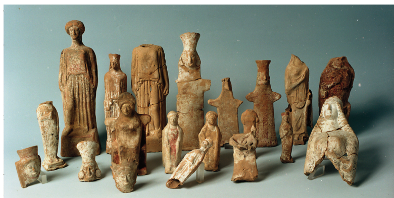
Εικ. 8. Κορώνεια, Σπήλαιο Νύμφης. Σύνολο ειδωλίων της αρχαϊκής περιόδου.

Στη Μαγούλα Κουτρουλού έχουν αποκαλυφθεί μεταξύ 2001 και 2010 σε πλήρη κάτοψη λίθινα θεμέλια και δάπεδα από δύο οικήματα της Μέσης Νεολιθικής σε διάφορες οικοδομικές φάσεις που περιτρέχουν όλη τη διάρκεια της όψης χιλιετίας π.Χ. (εικ. 7). Στα δάπεδα χρήσης εντός των κτηρίων βρέθηκαν κατά χώραν κεραμική, ειδώλια, εργαλεία, υπολείμματα διατροφής και μικροαντικείμενα. Οι τοίχοι του ενός κτηρίου έχουν κατασκευαστεί από πλάκες πηλού και σώζονται σε ικανό ύψος. Μεταξύ των οικημάτων έχουν ανασκαφεί ανοικτοί χώροι που εκτιμώνται ως χώροι οικοτεχνικών δραστηριοτήτων, λόγω της πληθώρας των ευρημάτων σε αυτούς.