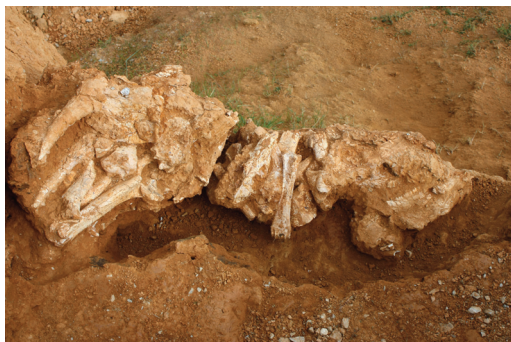
Εικ. 11. Σέσκλο Μαγνησίας. Απολιθώματα ζώων του Κάτω Πλειστόκαινου (2 εκατ. έτη).

παράλληλη χρήση ειδικού φωτισμού και γιγαντοφωτογραφιών. Η ΕΠΣΝΕ προετοιμάζει πρόταση ανάδειξης της θέσης ως σπηλαιούμουσείου για ένταξη στο ΕΣΠΑ.