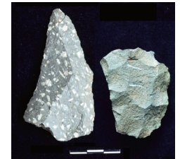
Εικ. 3-4. Γύθειο. Θέση «Λακωνίς». Ανασκαφικές τομές και τέχνεργα της Μέσης Παλαιολιθικής.

Το 2008 και 2009 η ΕΠΣΝΕ σε συνεργασία με την Αμερικανική Σχολή Κλασικών Σπουδών στην Αθήνα διενήργησε επιφανειακή έρευνα στην περιοχή του Πλακιάς και της Πρέβελης (εικ. 5) στη νότια Κρήτη με στόχο τον εντοπισμό προ-νεολιθικών θέσεων. Προηγούμενες έρευνες της ΕΠΣΝΕ και πανεπιστημιακών τμημάτων είχαν τεκμηριώσει την παρουσία της Μεσολιθικής στο νησιωτικό αιγαϊακό χώρο και αποτέλεσαν το έναυσμα για την αναζήτηση αυτής της φάσης και στην Κρήτη, όπου τα πρωιμότερα ίχνη κατοίκησης ανάγονταν στη Νεολιθική. Τα αποτελέσματα της έρευνας υπήρξαν πολύ σημαντικά γιατί εντοπίστηκαν όχι μόνο 28 μεσολιθικές θέσεις, αλλά και εννέα παλαιολιθικές, με πολλά ευρήματα (εικ. 6) που καταρχήν χρονολογούνται τουλάχιστον στα 130.000 χρόνια πριν από σήμερα. Η χρήση του νησιωτικού χώρου κατά την Παλαιολιθική τεκμηριώθηκε πολύ πρόσφατα διεθνώς και φαίνεται ότι τα θαλάσσια ταξίδια στην Κρήτη