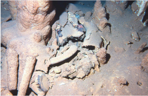
Εικ. 13. Διρός, Σπήλαιο Γλυφάδας. Απολιθωμένα οστά ζώων κατά χώραν.