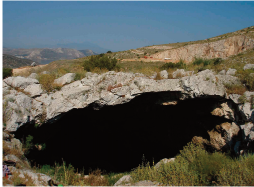
Εικ. 9. Κερασίни, Σπήλαιο Σχιστού. Η είσοδος.

Εντυπωσιακό σπήλαιο με πλούσιο σταλαγματικό διάκοσμο και μοναδικός στο είδος του αρχαιολογικός χώρος έγινε γνωστός το 2004 και ανασκάπτεται έκτοτε. Περιείχε συστάδες επιφανειακών ευρημάτων που βρέθηκαν στη θέση τους (εικ. 10): ομάδες ανθρώπινων σκελετών που ανήκουν σε περισσότερα από 50 άτομα, μαζί με ακέραια αγγεία και λυχνάρια, διάσπαρτα