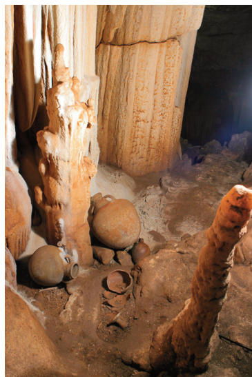
Εικ. 10. Σπήλαιο Ανδρίτσας. Αγγεία κατά χώραν, ανάμεσα στους σταλακίτες και σταλαγμαίτες του σπηλαίου.

Το 2005-2006 λόγω της σημασίας και της ιδιαιτερότητας του ευρήματος, πραγματοποιήθηκε περιοδική έκθεση στο Βυζαντινό και Χριστιανικό Μουσείο Αθηνών, όπου έγινε αναπαράσταση τμημάτων του σπηλαίου με έκθεση μέρους του επιφανειακού υλικού και