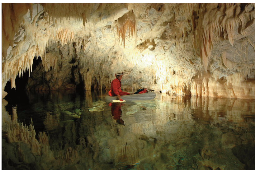
Εικ. 12. Διρός, Σπήλαιο Γλυφάδας. Εξερεύνηση στο λιμναίο.

Το Πικέρμι αποτελεί την παλαιότερη από τις τρεις θέσεις, τόσο από πλευράς γεωλογικής ηλικίας (7-7,5 εκατ. ετών), όσο και χρονολογίας ανακάλυψης, αφού είναι γνωστή από το 1836. Αποτελεί τόπο μεγάλης επιστημονικής σημασίας για την παλαιοντολογία, καθώς εκεί έχει αποκαλυφθεί πανίδα (διεθνώς γνωστή ως «πικερμική») από περισσότερα των 40 ειδών, η οποία συνιστά πρότυπο για τις αντίστοιχες ηλικίας πανίδες της Ευρασίας. Πρόσφατα, το 2008, εντοπίστηκε νέα εμφάνιση απολιθωμάτων στην περιοχή, η οποία ανασκάπτεται από το Πανεπιστήμιο Αθηνών σε συνεργασία με την ΕΠΣΝΕ. Μεταξύ των ειδών της πανίδας συγκαταλέγονται είδη ιππαρίων, αρχέγονα προβοσκιδωτά, ρινόκεροι, εκπληκτική ποικιλία αντιλοπών και πολλά είδη σαρκοφάγων. Μέρος του πρόσφατα ανασκαφέντος υλικού