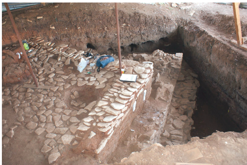
Εικ. 7. Νέο Μοναστήρι Φθιώτιδας, Μαγούλα Κουτρουλού. Επάλληλες φάσεις νεολιθικού κτηρίου της όψης χιλιετίας π.Χ.

υπήρξαν τα αρχαιότερα της Μεσογείου και από τα πρωιμότερα του κόσμου. Η έρευνα είχε έντονη δημοσιότητα στο διεθνή και ελληνικό τύπο, εντάχθηκε στις δέκα σημαντικότερες αρχαιολογικές ανακαλύψεις του 2010 από το περιοδικό Archaeology του Αμερικανικού Ινστιτούτου Αρχαιολογίας και συμπεριλήφθηκε στο «Βιβλίο της Χρονιάς» της Εγκυκλοπαίδειας Britannica . Τα αποτελέσματα παρουσιάστηκαν σε πολλά διεθνή συνέδρια και δημοσιεύθηκαν στο περιοδικό Hesperia . Το πρόγραμμα συνεχίζεται το 2011 ως συνεργασία της ΕΠΣΝΕ με την ΚΕ' ΕΠΚΑ και την ΑΣΚΣΑ.