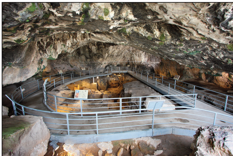
Εικ. 1. Σπήλαιο Θεόπετρας. Διάδρομος επισκεπτών.

οποία χρονολογείται στα τέλη της Παλαιολιθικής περιόδου (περίπου 14000 π.Χ.). Από το 2005 το σπήλαιο εντάχθηκε στο Γ' ΚΠΣ προκειμένου να διαμορφωθεί σε χώρο επισκέψιμο για το κοινό. Συγκεκριμένα, κατασκευάστηκε διάδρομος σε υποσπλήγματα, που περιτρέχει όλο το σπήλαιο (εικ. 1) και από τον οποίο μπορεί να έχει κανείς οπτική επαφή με όλα τα σκάμματα της ανασκαφής, όπου διατηρήθηκαν εστίες φωτιάς διαφόρων περιόδων, τα αποτυπώματα ανθρώπινων πελμάτων ηλικίας περίπου 130.000 χρόνων, ενώ στη στρωματογραφία προβάλλονται οι εναλλαγές του κλίματος (επεισόδια παγετώνων κτλ.). Αυτά φωτίζονται διακριτικά από λαμπτήρες σχεδόν μη εμφανείς, κάτω από το διάδρομο. Επί του κιγκλιδώματος έχουν τοποθετηθεί ενημερωτικές πινακίδες για τους επισκέπτες. Εξωτερικά του σπηλαίου δημιουργήθηκαν κλίμακες πρόσβασης και για ΑΜΕΑ μέχρι το σπήλαιο και μικρό κτίσμα-φυλάκιο για την υποστήριξη των Η/Μ εγκαταστάσεων. Στο πλαίσιο των σωστικών ανασκαφών για την εγκατάσταση του διαδρόμου στο εσωτερικό του σπηλαίου αποκαλύφθηκαν στη βορειοανατολική περιοχή του, κοντά στην είσοδο, δύο