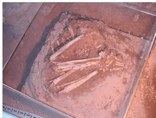
Εικ. 2. Σπήλαιο Θεόπετρας. Ταφή της Μεσολιθικής περιόδου (περίπου 7000 π.Χ.) εγκλιωτισμένη σε πλέξιγκλας.