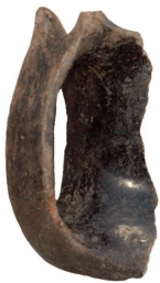
Εικ. 1-2. Σπήλαιο Μαρώνειας. Τμήμα κανθαρόσχημου αγγείου της πρώιμης εποχής του Χαλκού και εφυσωμένη κεραμική της Ομάδας του Ζευξίππου.

Το σπήλαιο «Καταρράκτες (Φράγμα)» Σιδηροκάστρου Σερρών περιλαμβάνει μια βραχοσκεπή μεγάλων διαστάσεων (εικ. 3) και δύο μικρότερα έγκοιλα. Από την ανασκαφική