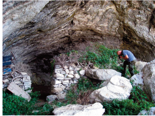
Εικ. 9. Πήλιο. Το σπήλαιο Τσουνάγκα, με τοίχο από ξερολιθιά στην είσοδό του.

κατάλοιπα. Σε καμία περίπτωση τα κατάλοιπα δεν βρέθηκαν σε πρωτογενή απόθεση. Στη Ραχώνα τα ευρήματα χρονολογούνται στη Μέση Παλαιολιθική, μεταξύ δε αυτών ξεχωρίζουν τα προϊόντα Λεβαλλουά και λίγα ξέστρα καλής ποιότητας (εικ. 10). Ο μεγάλος αριθμός τέχνεργων από προχωρημένα στάδια κατεργασίας μαρτυρεί ότι τα περισσότερα τέχνεργα προέρχονται από καταυλισμούς. Το Πολύπειτρο αποτελούσε θέση προσπορισμού και επιτόπιας κατεργασίας της πρώτης ύλης («εργαστήριο»), η οποία άφησε κατάλοιπα από διάφορες εποχές, από τη Μέση Παλαιολιθική έως και τους ιστορικούς χρόνους. Στη Γοργόπη ερευνήθηκαν οι τομές που είχε δημιουργήσει η διάνοιξη δρόμου, που τέμνει ένα σπάραγμα αναβαθμίδας πάχους περίπου 10 μ. Σημαντικός αριθμός λίθινων τέχνεργων συλλέχθηκε τόσο μέσα στα στρώματα όσο και στη βάση της τομής, όπου είχαν καταπέσει.