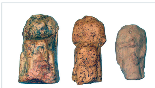
Εικ. 7. Άρτα. Ιερό Άντρο Νυμφών. Πήλινα ειδώλια.

Οι επιχώσεις ήταν αναμοχλευμένες από τη δράση των λαθρανασκαφών, ενώ σε κανένα από τα δύο τετράγωνα της ανασκαφής δεν εντοπίστηκε αδιάτάρακτο αρχαιολογικό στρώμα. Ωστόσο, περισυνελέγη ικανή ποσότητα κεραμικής και αρκετά μικροευρήματα, όπως δύο κωνικά κομβία από στεατίτη, ένα πήλινο αμφικωνικό σφονδύλι, ένα χάλκινο νόμισμα κ.ά. Η προκαταρκτική εξέταση των ευρημάτων τεκμηριώνει τη χρήση του σπηλαίου κατά τη νεολιθική και τη μυκηναϊκή περίοδο, ενώ μεμονωμένα ευρήματα μαρτυρούν περιστασιακή χρήση του και κατά τους κλασικούς - ελληνιστικούς χρόνους, καθώς και στην ύστερη αρχαιότητα.