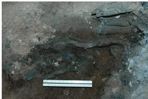
Εικ. 4-5. Καταρράκτες Σιδηροκάστρου. Τμήμα πασσαλόπηκτου κτίσματος της πρώιμης εποχής του Χαλκού I και απανθρακωμένα κλαδιά, στοιχεία της ανωδομής του.