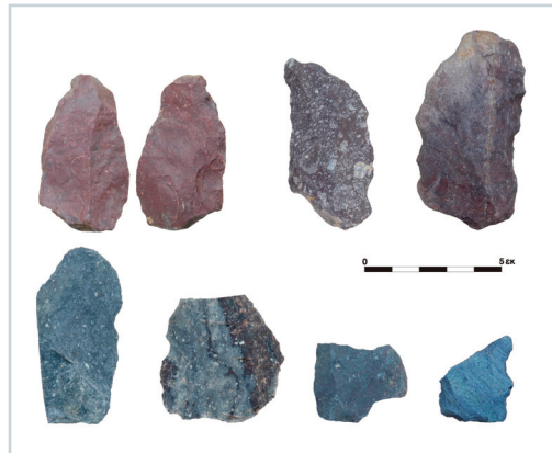
Εικ. 10. Ραχώνα Πέλλας. Χαρακτηριστικά τέχνεργα της Μέσης Παλαιολιθικής.

κατάλοιπα. Σε καμία περίπτωση τα κατάλοιπα δεν βρέθηκαν σε πρωτογενή απόθεση. Στη Ραχώνα τα ευρήματα χρονολογούνται στη Μέση Παλαιολιθική, μεταξύ δε αυτών ξεχωρίζουν τα προϊόντα Λεβαλλουά και λίγα ξέστρα καλής ποιότητας (εικ. 10). Ο μεγάλος αριθμός τέχνεργων από προχωρημένα στάδια κατεργασίας μαρτυρεί ότι τα περισσότερα τέχνεργα προέρχονται από καταυλισμούς. Το Πολύπειτρο αποτελούσε θέση προσπορισμού και επιτόπιας κατεργασίας της πρώτης ύλης («εργαστήριο»), η οποία άφησε κατάλοιπα από διάφορες εποχές, από τη Μέση Παλαιολιθική έως και τους ιστορικούς χρόνους. Στη Γοργόπη ερευνήθηκαν οι τομές που είχε δημιουργήσει η διάνοιξη δρόμου, που τέμνει ένα σπάραγμα αναβαθμίδας πάχους περίπου 10 μ. Σημαντικός αριθμός λίθινων τέχνεργων συλλέχθηκε τόσο μέσα στα στρώματα όσο και στη βάση της τομής, όπου είχαν καταπέσει.