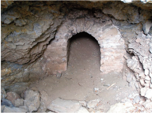
Εικ. 8. Πήλιο. Τεχνητή διαμόρφωση στην είσοδο σπηλαίου, στην περιοχή της Κάρλας.