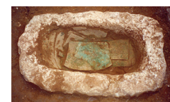
Εικ. 2. Άργος, οικόπεδο Ε. Σμυρναίου. Λίθινη θήκη με ενεπίγραφους πίνακες.