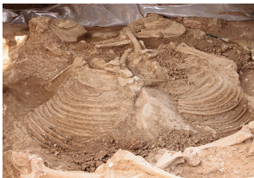
Εικ. 9-10. Δενδρά. Μυκηνναϊκό νεκροταφείο. Ταφή αλόγων και το στέγαστρο-προθήκη της.