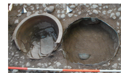
Εικ. 3. Άργος, οικόπεδο Ε. Σμυρναίου. Το χάλκινο και το πήλινο αγγείο με τους ενεπίγραφους πίνακες.