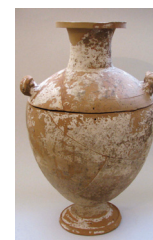
Εικ. 4. Άργος, οικόπεδο Ι. Αλεξόπουλου. Ο τεφροδόχος αμφορέας.