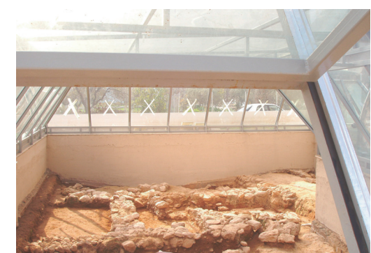
Εικ. 6. Οικόπεδο Κακοϊμάμπ. Οδός και φρέαρ του πρωτοελλαδικού οικισμού.