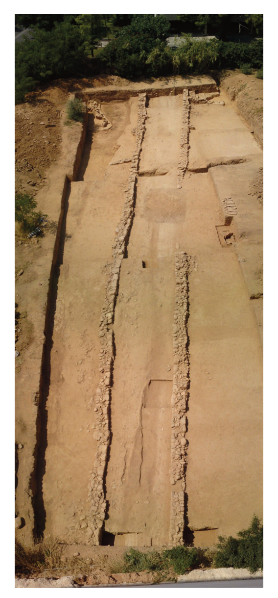
Εικ. 8. Αρχαία οδός Λιθαγωγίας. Άποψη από ΒΑ.

Το αρχαίο θέατρο των Αχαρνών (εικ. 10-11) αποκαλύφθηκε στην οδό Σαλαμίνος 21, κοντά στη διασταύρωση με την οδό Λιοσίων, σε πικνοκατοικημένη περιοχή στο κέντρο του σημερινού δήμου, σε εκσκαφή για την ανέγερση οικοδομής. Το μεγαλύτερο τμήμα του θεάτρου, η ορχήστρα και η σκηνή βρίσκονται κάτω από το οδόστρωμα της οδού. Ο προσανατολισμός του είναι προς τα Δ.-ΒΔ. Θέατρα δεν έχουν βρεθεί σε όλους τους αρχαίους δήμους της Αττικής και δεν φαίνεται να διέθεταν όλοι αλλά μόνον οι μεγαλύτεροι και οι σπουδαιότεροι.