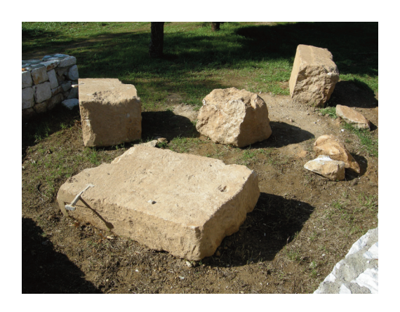
Εικ. 9. Μαραθώνας. Οι αρχαίοι δόμοι με τους μολύβδινους συνδέσμους.

Η σημασία της αποκάλυψης του θεάτρου των Αχαρνών είναι τεράστια, καθώς πέρα από το ίδιο το μνημείο, καθορίζει τη θέση του πολιτικοθρησκευτικού κέντρου του αρχαίου δήμου, το οποίο αναζητούσαν από παλιά ξένοι και