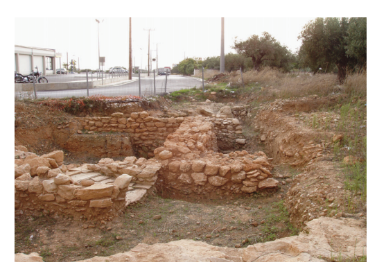
Εικ. 5. Οικόπεδο Παπαχρήστου. Οδός και ορθογώνια κτίσματα του πρωτοελλαδικού οικισμού.