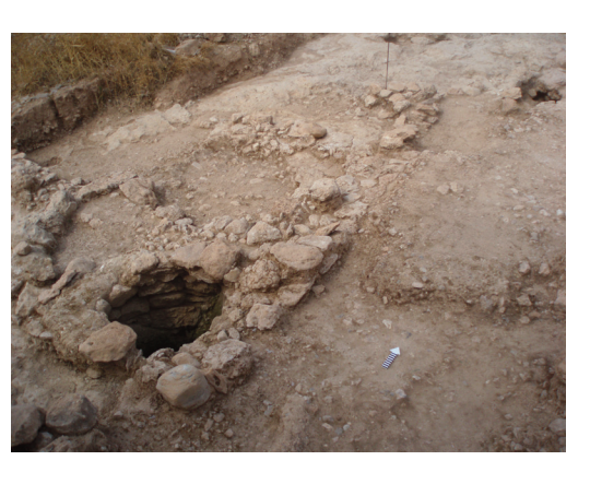
Εικ. 7. Οδός Θάνου (Ο.Τ. 293-294). Γενική άποψη του πρωτοελλαδικού οικισμού. Δεξιά, η οδός.