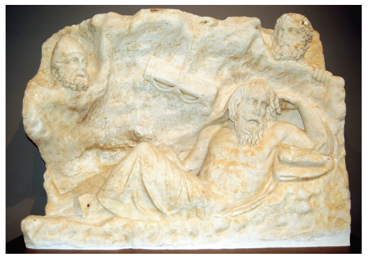
Εικ. 3. Ανάγλυφο με παράσταση του Φιλοκτήτη.

τον Παυσανία ναό της Αρτέμιδος Κολαινίδος (εικ. 1). Περίβολος με μνημειώδη είσοδο και προσκτίσματα ταυτίζεται με το ιερό του Φρατρίου Διός, σύμφωνα με επιγραφή που βρέθηκε σε παρακείμενο φρέαρ (εικ. 2). Το ιερό της Αφροδίτης περιελάμβανε τριμερές οικοδόμημα και κατάφυτο αίθριο με δεξαμενή. Το όνομα μιας ιέρειας, ΝΑΝΝΙΟΝ, σώζεται σε σχιστολιθική πλάκα. Τέλος, ανασκάφηκε μικρό αγροτικό ιερό, πιθανώς της Δήμητρας. Στα δημόσια κοσμικά κτήρια κατατάσσεται επίμηκες κτηριακό συγκρότημα και μικρό στωικό κτήριο των κλασικών χρόνων. Δεύτερο στωικό κτήριο του 4ου αι. π.Χ. απέδωσε μολύβδινο σταθμίο με παράσταση χελώνας και χάλκινη αθωωτική δικαστική ψήφο.