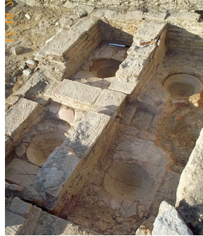
Εικ. 10-11. Ποταμοί Αμαρίου. Ο υπόκαυτος χώρος του λουτρού και εργαστηριακή εγκατάσταση.

στα μέσα του 3ου και στον 6ο αιώνα, αντίστοιχα. Ιδιαίτερο ενδιαφέρον παρουσιάζει το στρώμα καταστροφής που σηματοδοτεί και το τέλος χρήσης του χώρου, καθώς από αυτό προέρχεται ένας μεγάλος αριθμός αγγείων που αποκαθίστανται σχεδόν ακέραια.