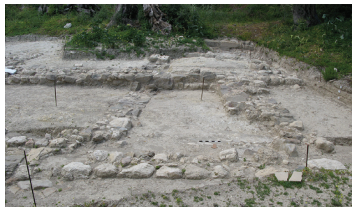
Εικ. 12. Μαρουλάς Ρεθύμνου. Γενική άποψη της αγροτικής έπαυλης.

Στο πλαίσιο σωστικής ανασκαφής πραγματοποιήθηκε έρευνα σε ακίνητο πλησίον της βασιλικής της Αλμυρίδος Αποκορώνου. Στο