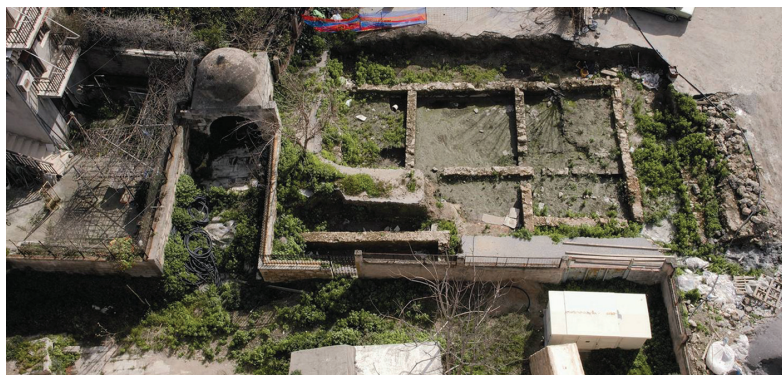
Εικ. 2. Παλιά Πόλη Ρεθύμνου. Μονή των Αυγουστινιανών μοναχών. Συγκροτήματα κεραμικών.