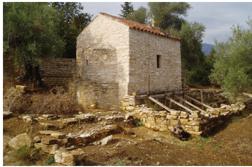
Εικ. 15. Βαφές Αποκορώνου. Αγγεία από την ανασκαφή.