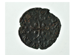
Εικ. 5. Δίδυμο Κτήριο Φορτέτζας Ρεθύμνου. Sessino του Pasc. Ciconna (1585-1595).

Μικρής έκτασης ανασκαφικές τομές διενερ-