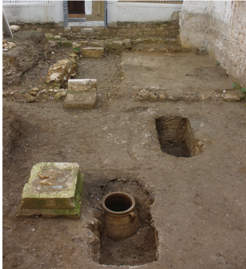
Εικ. 4. Παλιά Πόλη Ρεθύμνου. Άγιοι Απόστολοι. Το νότιο κλίτος του ναού κατά τη διάρκεια της ανασκαφικής έρευνας. Διακρίνεται ο τάφος 1, με τον πήθο στο εσωτερικό του.

Την περίοδο Σεπτέμβριος-Οκτώβριος του 2010, στο πλαίσιο έναρξης του έργου αποκατάστασης του Δίδυμου Κτηρίου στη Φορτέτζα Ρεθύμνου , το οποίο χρηματοδοτείται από το πρόγραμμα ΕΣΠΑ, ολοκληρώθηκε η ανασκαφική έρευνα στο εσωτερικό του. Η ανασκαφή, μέρος της οποίας είχε διενεργηθεί το έτος 2003, έφερε στο φως τμήμα κτίσματος, το οποίο εκτεινόταν κυρίως στο δυτικό θόλο του Δίδυμου Κτηρίου. Συγκεκριμένα, αποκαλύφθηκαν πέντε χώροι σε ύψος μόλις 0,20-0,30 μ. θεμελιωμένοι κατά το μεγαλύτερο μέρος τους πάνω στο φυσικό βράχο, ο οποίος είχε μπαζωθεί με κοκκινόχωμα προκειμένου να εξομαλυνθεί η επιφάνειά του. Το κτίσμα ήταν κατασκευασμένο από αργολιθοδομή και επιχρισμένο με ανοιχτόχρωμο ασβεστοκονίαμα εσωτερικά και εξωτερικά, ενώ έφερε ένα, τουλάχιστον, θύρωμα εισόδου στα νότια, από το οποίο αποκαλύφθηκε