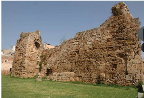
Εικ. 20. Γενική άποψη του βυζαντινού τείχους των Χανίων.

το υπόλοιπο της επιμελημένης ελλειψοειδούς χαμηλής πλατείας, και οι εσωτερικές αντηρίδες που στήριζαν τις τοξωτές κατασκευές αντιστήριξης περιμετρικά του κυρίως προμαχώνα.