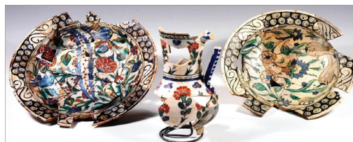
Εικ. 13. Παλιόχωρα Σελίνου. Αγγεία από την ανασκαφή του Castel Selino .