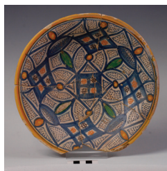
Εικ. 1. Παλιά Πόλη Ρεθύμνου. Πινάκιο από την ανασκαφή του συγκροτήματος των Αυγουστινιανών μοναχών.

Στο οικόπεδο της οδού Καστρινογιαννάκη , στην Παλιά Πόλη Ρεθύμνου, ήλθε στο φως κατά τα έτη 2009-2010, το σύνολο του ναού των