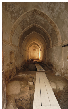
Εικ. 3. Παλιά Πόλη Ρεθύμνου. Ναός Αγίας Παρασκευής. Άποψη από το εσωτερικό του κατά τη διάρκεια της ανασκαφής.