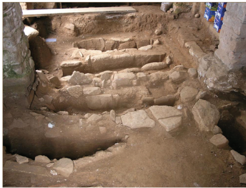
Εικ. 19. Αλικιανός Κυδωνίας. Οι ταφές από το εσωτερικό του ναού της Ζωοδόχου Πηγής (Αϊ Κυρ Γιάννης).

Σημαντικά στοιχεία αποκαλύφθηκαν μπροστά από το παλαιοχριστιανικό τείχος των Χανίων , στις ανασκαφές που εκτελέστηκαν από το Γραφείο Τειχών του ΤΔΠΕΑΕ, υπό την επιβλεψη της 28ης ΕΒΑ. Διαπιστώθηκε ότι ο οχυρωματικός περιβόλος πατά εν μέρει πάνω στον ελληνιστικό, ο οποίος είναι θεμελιωμένος σε λείψανα του υστερομινωικού οικισμού. Μπροστά από το τείχος αποκαλύφθηκε χαμηλό προτείχισμα (εικ. 20) που προσδιόριζε το χώρο υγρής τάφρου, η οποία πιθανώς περιέτρεχε το λόφο Καστέλλι και τον απέκοπτε από την ξηρά. Περιμετρικά του ορθογώνιου επιπρομαχώνα της Santa Katerina αποκαλύφθηκαν λείψανα των κανονιοθυρίδων. Στον παρακείμενο επιπρομαχώνα του San Salvatore , μετά την κατεδάφιση του ακαλαίσθητου ξενοδοχείου ΧΕΝΙΑ, αποκαλύφθηκε