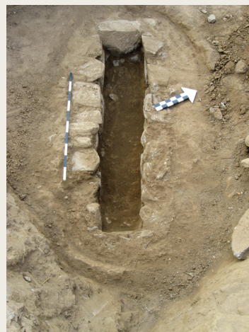
Εικ. 10-11. Τάφος 2.