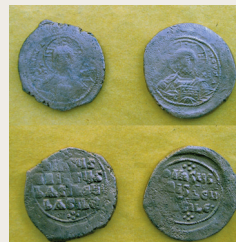
Εικ. 7. Δύο ανώνυμοι φόλλεις, 976-1030/35, Κωνσταντινούπολης.