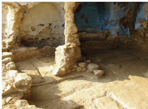
Εικ. 3. Σπήλαιο ΥΒ4.

Ανδρόνικο Β', ο πρώτος εκτοπίζει τον Θεόδωρο Μετοχήτη σε μία από τις μονές του Διδυμοτείχου. Ο Θεόδωρος Μετοχήτης είναι ο συγγραφέας του βίου του μοναχού και μετέπειτα αγίου Ιωάννη του Νεότερου, ο οποίος έζησε και έδρασε στο Διδυμότειχο την εποχή του Βασιλείου Β' (976-1025). Τέλος, είναι γνωστό ότι ο οσιομάρτυς Ιάκωβος και οι δύο μαθητές του, ο διάκονος Ιάκωβος και ο μοναχός Διονύσιος, μαρτύρησαν το 1520 στο Διδυμότειχο.