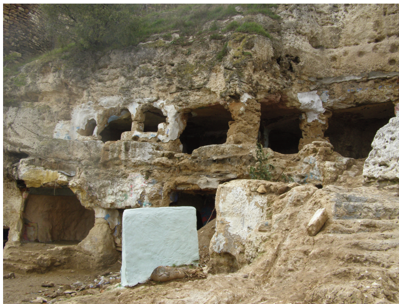
Εικ. 1. Αποψη των νεοευρεθέντων σπηλαίων κάτω από τον πύργο της Βασιλοπούλας.

πεδο διατηρημένο σε πολλά εξ αυτών. Τα αποκαλυφθέντα σπήλαια είναι 13 (ΥΑ 1-ΥΑ 9 και ΥΒ 1-ΥΒ 4). Η είσοδός τους βρίσκεται νότια, πλην του ΥΒ 4 που βρίσκεται ανατολικά. Το μήκος της πρόσοψής τους κυμαίνεται από 3 έως 12 μ., το βάθος από 1,50 έως 11,50 μ., ενώ το ύψος των εσωτερικών χώρων, μη λαμβανομένου υπόψη του βάθους της επίκωσης, από 1,60 έως 2 μ. Στην πλειονότητά τους τα σπήλαια φέρουν στο κάτω μέρος λαξευμένες βαθύνσεις για τη στήριξη πιθαριών και κογχόσχημες κοιλότητες στα τοιχώματα για την τοποθέτηση αντικειμένων. Σε ορισμένα υπάρχουν λαξευμένες οπές-δοκοθήκες για την υποδοχή πιθανώς δοκαριών για στήριξη πατώματος ορόφου.