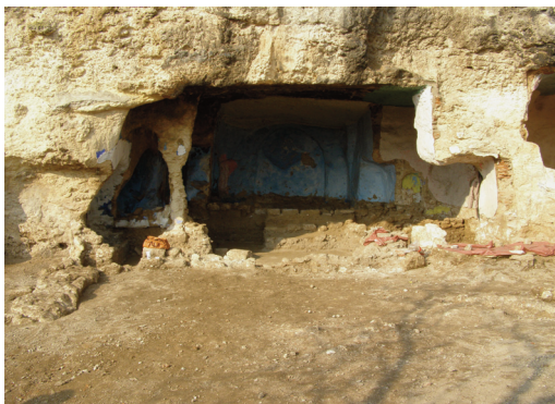
Εικ. 2. Σπήλαιο ΥΒ 1.