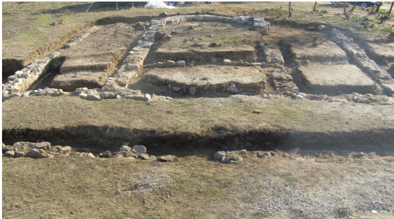
Εικ. 4-5. Πηγάδια Κιμμερίων. Ο παλαιοχριστιανικός ναός και τμήματα τοίχων πιθανόν ανήκοντα σε παρακείμενους βοηθητικούς χώρους.