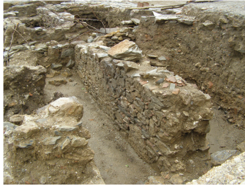
Εικ. 14-15. Μάκρη Έβρου. Απόψεις του βορειοανατολικού τμήματος του ανεσκαμμένου χώρου, πλησίον του ναού της Αγίας Αναστασίας.