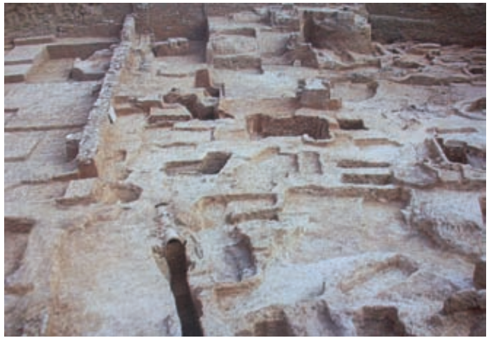
Άποψη της ανασκαφής του Νεκροταφείου του Κεραμεικού στα 1870.