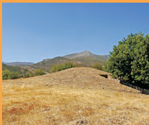
Ο τύμβος των Πλαταιέων

πλεονεκτήματα του δικού του στρατού και εξουδετέρωσε αυτά του αντιπάλου.