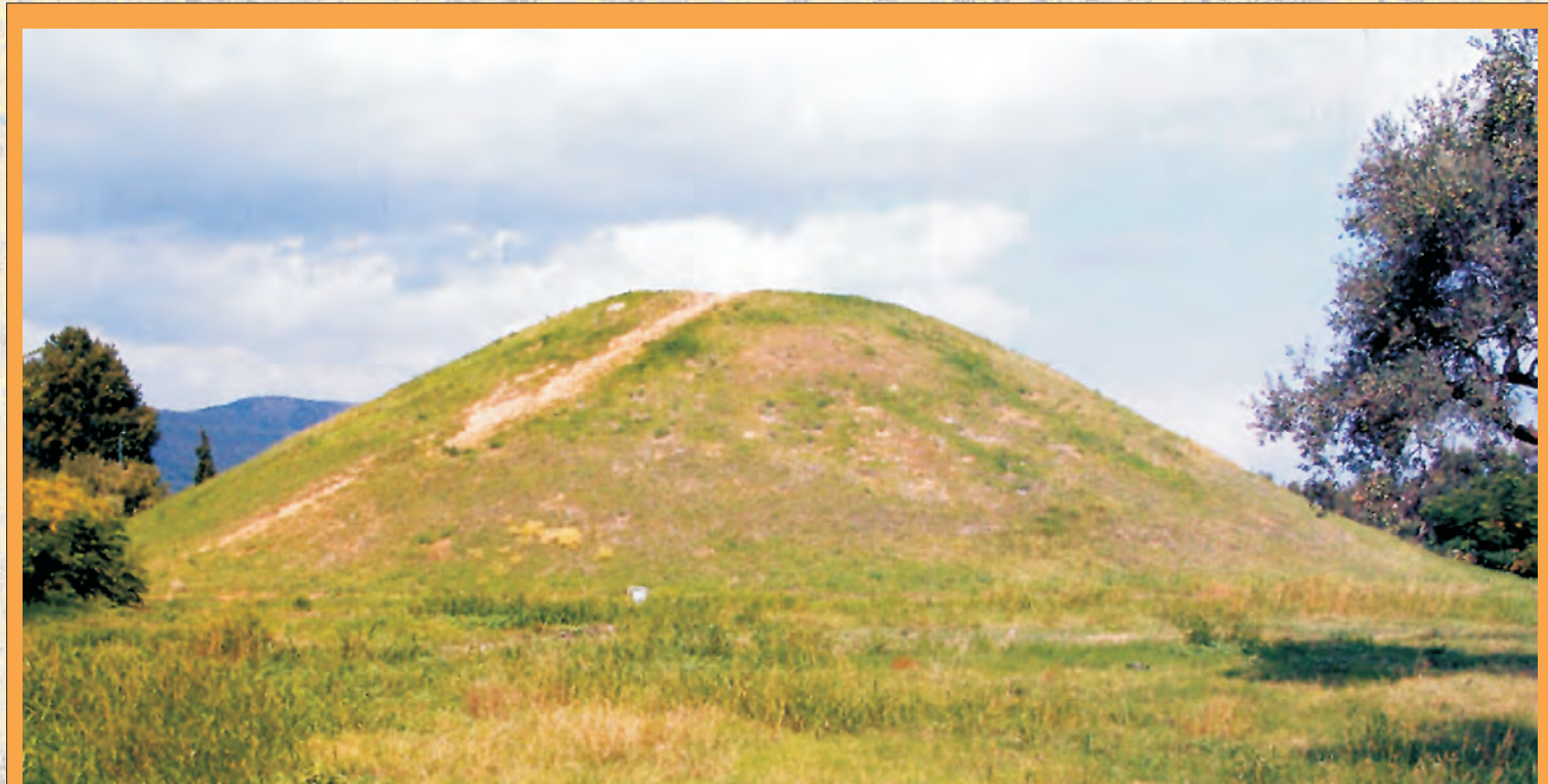
Ο τύμβος των Αθηναίων

«ΕΛΛΗΝΩΝ ΠΡΟΜΑΧΟΥΝΤΕΣ ΑΘΗΝΑΙΟΙ ΜΑΡΑΘΩΝΙ ΧΡΥΣΟΦΟΡΩΝ ΜΗΔΩΝ ΕΣΤΟΡΕΣΑΝ ΔΥΝΑΜΙΝ»