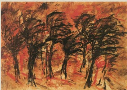
Γιώργος Ξένος, χωρίς τίτλο, 1995, 100x70 εκ.