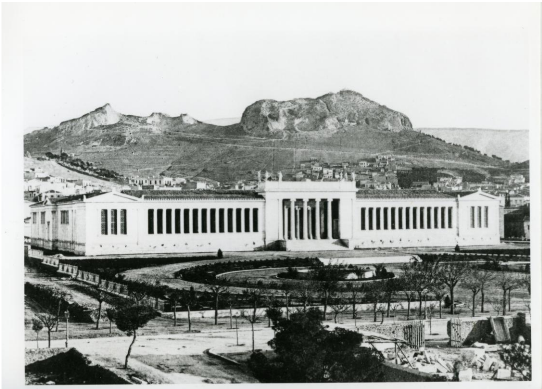
Εικ. 4. Το Εθνικό Αρχαιολογικό Μουσείο κατά την περίοδο της ίδρυσής του.

Μετά το θάνατο του Κ. Πιττάκη, Γενικός Έφορος Αρχαιοτήτων ανέλαβε ο Παναγιώτης Ευστρατιάδης έως το 1884, στα χρόνια διοίκησης του οποίου ιδρύθηκε το Εθνικό Αρχαιολογικό Μουσείο και το Μουσείο Ακροπόλεως. Στο αξίωμα αυτό ακολούθησε για μικρό χρονικό διάστημα ο Παναγιώτης Σταματάκης , με πλούσιο ανασκαφικό έργο, κυρίως στη Βοιωτία και Λακωνία, ο οποίος ασχολήθηκε και με την ίδρυση σημαντικών Μουσείων και αρχαιολογικών συλλογών.