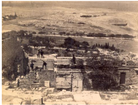
Εικ. 5-6. Ανασκαφές Ακροπόλεως 1885-1890