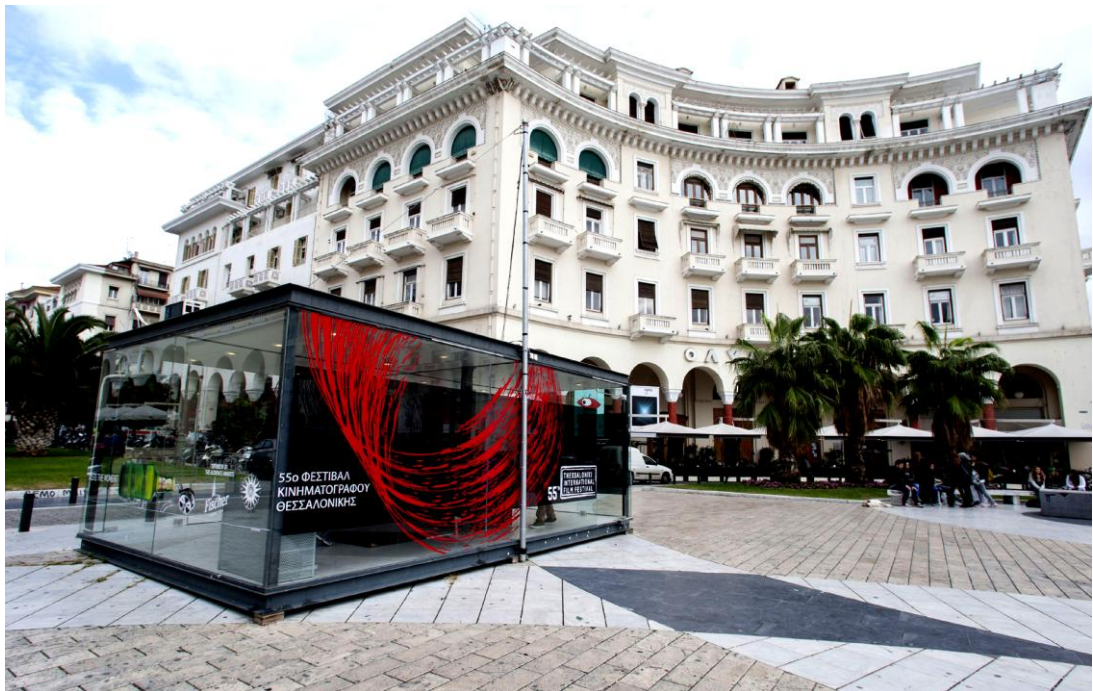
Εικ. 3. Εξωτερική άποψη του Θεάτρου ΟΛΥΜΠΙΟΝ- έδρα του ΦΕΣΤΙΒΑΛ ΘΕΣΣΑΛΟΝΙΚΗΣ

Το 1980, με τον Ν. 1075/1980 (ΦΕΚ Α΄218) προβλέφθηκε, μεταξύ άλλων, η μεταφορά των αρμοδιοτήτων επί της κινηματογραφίας στο Υπουργείο Πολιτισμού και Επιστημών από το τότε Υπουργείο Βιομηχανίας και Ενέργειας. Έξι χρόνια αργότερα, με τον Ν. 1597/1986 (ΦΕΚ Α΄68), το κινηματογραφικό έργο αντιμετωπίζεται ως πολιτιστικό προϊόν και διασφαλίζεται η συνολική ενίσχυση της ελληνικής κινηματογραφίας σε μόνιμη βάση. Με τον ίδιο νόμο, το Ελληνικό Κέντρο Κινηματογράφου γίνεται Ανώνυμη Εταιρεία του Δημοσίου, που εποπτεύεται και επιχορηγείται από το Υπουργείο και ανάγεται σε έναν από τους κυριότερους μοχλούς άσκησης της κινηματογραφικής πολιτικής.