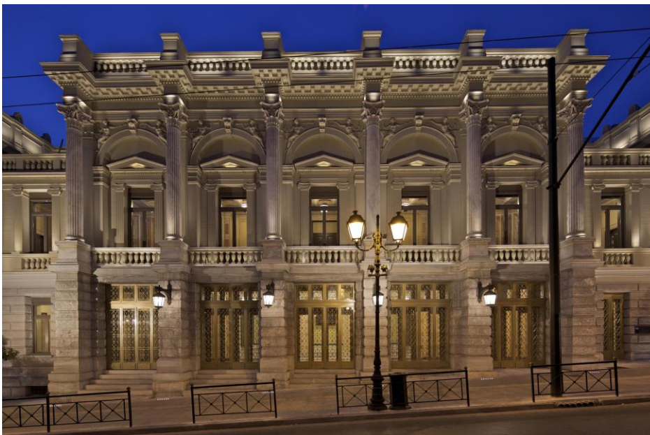
Εικ. 1. Το κεντρικό κτήριο του Εθνικού Θεάτρου, στην οδό Αγίου Κωνσταντίνου, στην Αθήνα, δημιουργήμα του Er. Ziller

Άλλοι οργανισμοί που υπηρέτησαν και καλλιέργησαν συστηματικά τις επιμέρους τέχνες ήταν το Ωδείο Αθηνών (1871), η Εθνική Πινακοθήκη-Μουσείο Αλ. Σούτζου (1900), το Κρατικό Ωδείο Θεσσαλονίκης (1914), το Εθνικό Θέατρο (1930), η Μόνιμη Επιτροπή Διεθνούς Καλλιτεχνικής Εκθέσεως Βενετίας (1937), η Εθνική Λυρική Σκηνή (1939), το Επιμελητήριο Εικαστικών Τεχνών Ελλάδος (1944), το Κρατικό Θέατρο Βορείου Ελλάδος (1961), η Ταινιοθήκη της Ελλάδος (1963), κ.ά. Αξίζει να σημειωθεί ότι αρκετοί φορείς συστάθηκαν αρχικά με ιδιωτική πρωτοβουλία, αλλά σταδιακά περιήλθαν στο Δημόσιο, είτε ως ΝΠΔΔ είτε ως ΝΠΙΔ.