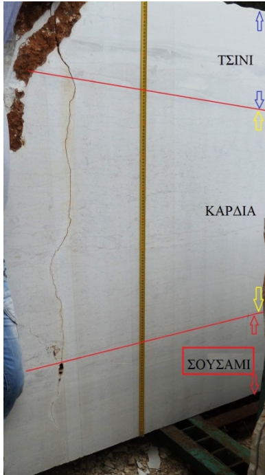
εικ.1: "Σπέσιαλ Κληματιάς"